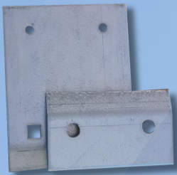
Kopėčių laikiklis Klasika dangai